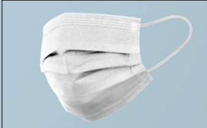
Mascarilla Quirúrgica Premium >98% Mascarilla de un solo uso