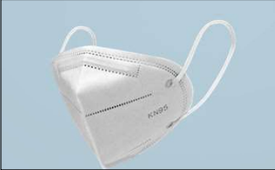
Respirador KN95 >95% Respirador de un solo uso