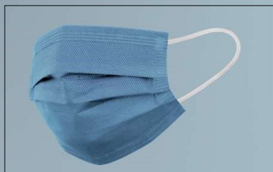
Mascarilla Quirúrgica | Item No 5855xxx