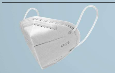
Mascarilla KN95 | Item No 5855xxx