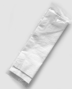
Servilleta Individual Grande | Item No 2997xxx

Servilleta amigable con la piel para manos y superficies