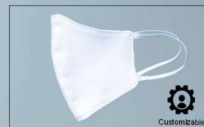
Reusable Utility Mask | Item No 8047001