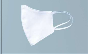
Mascarilla Utility +60-70% Mascarilla Re-usable