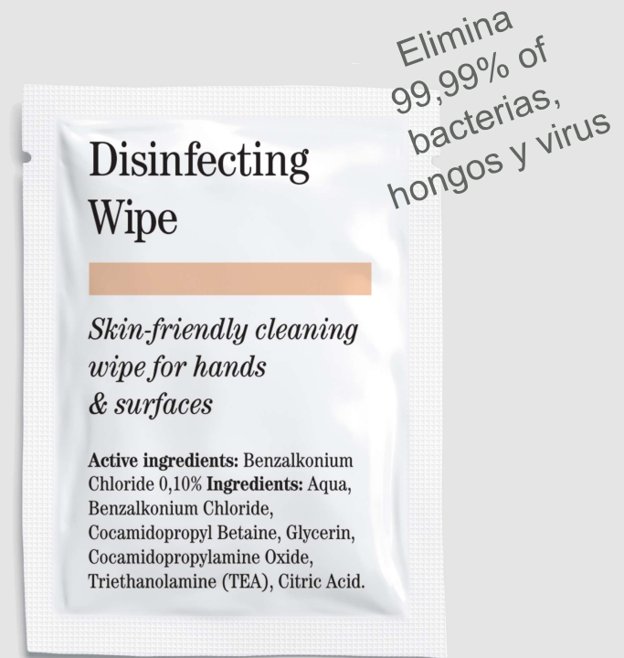
Foto del producto solo con fines ilustrativos.