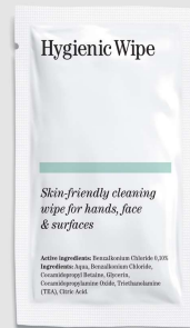
Wipe Higienico (Medio) | Item No 4685001