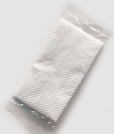
Servilleta Individual Pequeña | Item No 2997xxx

Servilleta amigable con la piel para manos y superficies