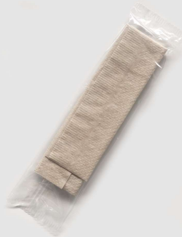
Servilleta Individual Mediana | Item No 2997xxx

Servilleta amigable con la piel para manos y superficies