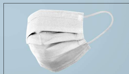
Mascarilla Quirúrgica F2100 | Item No 5855008