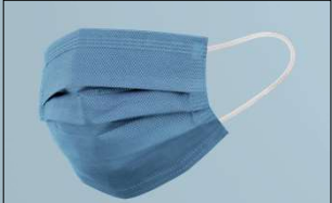
Mascarilla Quirúrgica >95% Mascarilla de un solo uso